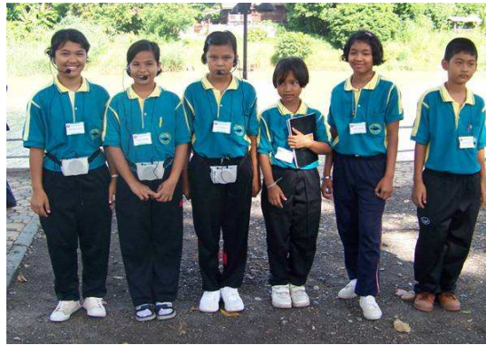
มัคคุเทศก์น้อยผู้นำนักท่องเที่ยวท้องถิ่น